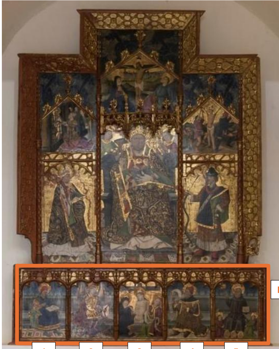
Parte de abajo