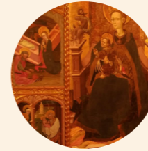
Retablo de la Virgen Martín del Cano y Maestro de Retascón s. XV Gótico internacional Iglesia de la Virgen de la Asunción