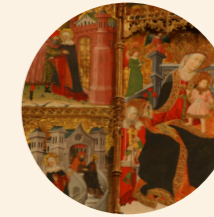
Retablo de la Virgen, Retablo de Santas Justas y Rufina, Predela VVAA, entre ellos Blasco de Grañén, Domingo Ram o Martín de Soria s. XV Gótico internacional Iglesia de la Virgen del Rosario