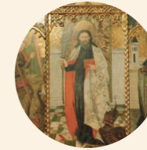
Retablo de San Bartolomé Desconocido s. XV Gótico Iglesia de la Virgen del Rosario