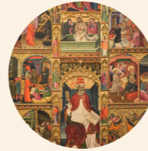
Retablo de San Pedro Martín del Cano s. XV Gótico internacional Iglesia de San Pedro