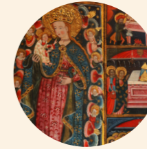
Retablo de la Virgen de los Ángeles Martín del Cano s. XV Gótico internacional Iglesia de Nuestra Señora de la Asunción