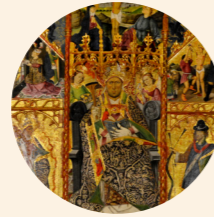
Retablo de San Blas Juan de Bonilla (menor) s. XV Gótico hispanoflamenco Iglesia de San Lorenzo