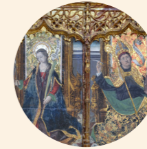
Predela de Sta. Apolonia, Sta. Águeda, San Agustín, Sta. Brígida, San Quílez y Sta. Bárbara Martín Bernat s. XV Gótico hispanoflamenco Iglesia de San Lorenzo